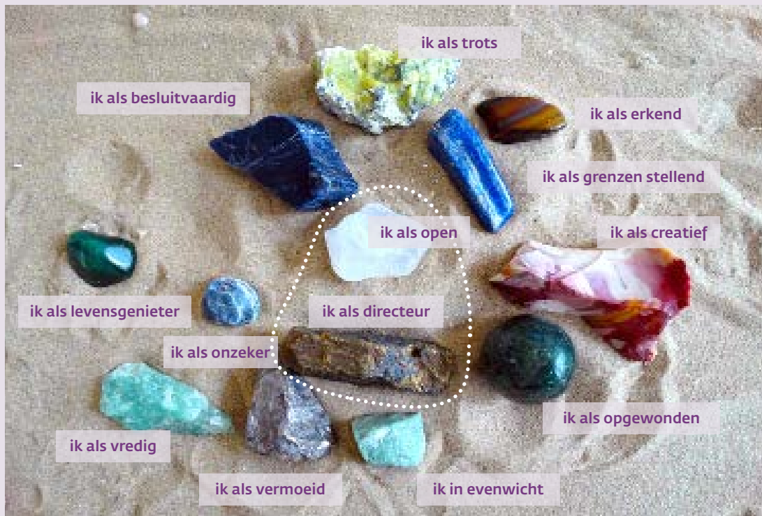
FIGUUR 4. TWEDE COMPOSITIE

transparante steen in figuur 4). Deze positie ligt bij het tweede onderzoek van Steven centraal en is door zijn nabijheid ten opzichte van zijn positie als directeur in staat deze in gunstige zin te beïnvloeden. Deze openheid motiveerde hem om zijn bevindingen met zijn team te bespreken. Een promotor-positie wordt gekenmerkt door een grote openheid naar de toekomst, oefent invloed uit op meerdere andere posities in het systeem en is zelfs in staat om in de loop van de tijd nieuwe posities te genereren. (Zie voor onderzoek naar de relatie tussen dialoog en openheid Oles & Puchalska-Wasył (2012) die de relatie onderzochten tussen interne dialoog en de 'Big Five' persoonlijkheidsdimensies en de hoogste correlaties vonden met de eigenschap 'openness to experience'.)