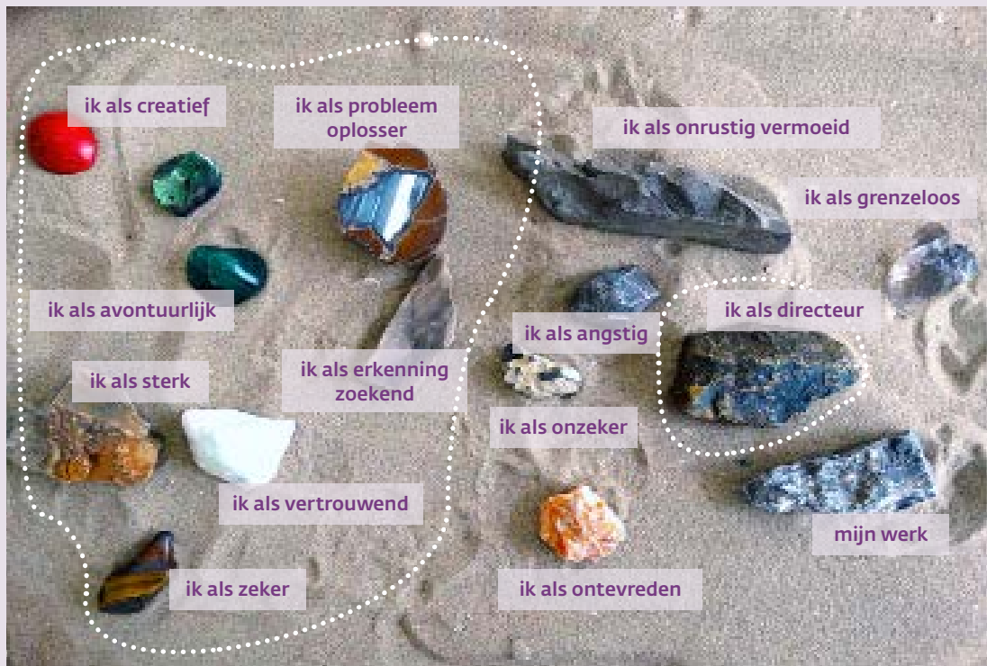
FIGUUR 3. EERSTE COMPOSITIE

duidelijk welke activiteiten hem energie gaven en welke niet. Hij opperde dat zowel zijn bedrijf als hijzelf meer gebaat zouden zijn als zijn werk meer van zijn creativiteit zou vergen. Hij stelde een wijziging van zijn takenpakket voor. Het team stemde in met zijn voorstel.